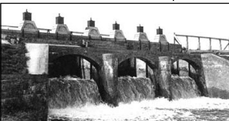
Inundatiesluis in de Beemster - 1944

In 2015 is het 70 jaar geleden dat Nederland bevrijd werd. In de beide musea en door de afdeling Beemster Erfgoed wordt hieraan bijzondere aandacht besteed. Hiervoor vragen we nu al uw aandacht. Heeft u nog voorwerpen, verhalen, anekdotes, ervaringen, dagboeken, boeken en/of krantenknipsels, of iets dergelijks die we mogen lenen, dan zijn we daar bijzonder in geïnteresseerd. Hoe klein het ook is, het kan van enorme waarde zijn. Meld dit bij het secretariaat van het HGB of meld het via info@historischgenootschapbeemster.nl . We nemen dan contact met u op. ◀