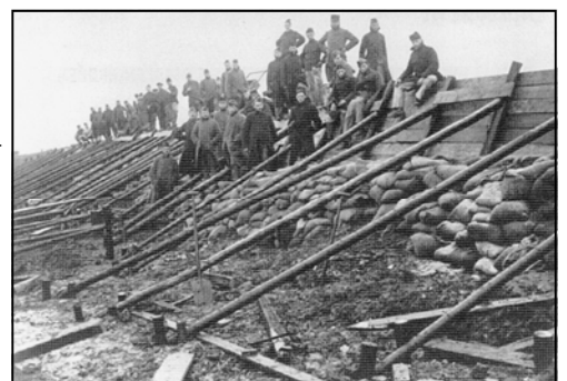
Kistdammen ter versterking van de Waterlandse zeedijken. Militairen uit de forten van de Beemster helpen bij de aanleg hiervan.

Deze tentoonstelling is uw bezoek zeker waard. U leest er eendaags meer over in de pers. Hebt u nog informatie over deze watersnood dan zijn we daar erg in geïnteresseerd. ◀